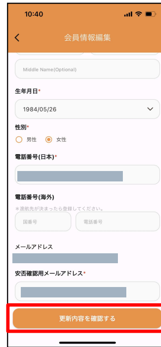
③変更したい箇所を入力し「更新内容を確認する」をタップ