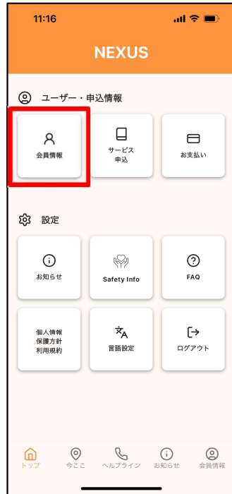
①「会員情報」をタップ