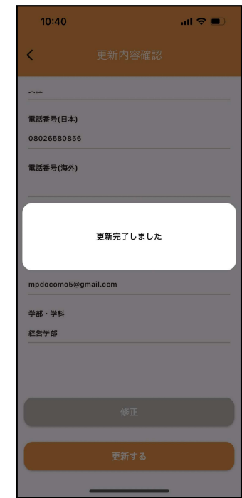
⑤「更新完了しました」で変更完了

会員個人ではなく、学校・団体により会員登録・申込が行われる場合は携帯電話番号・緊急連絡先（名前・本人との関係・電話番号・住所）の初期値は、会員ご自身にてご修正頂きます。