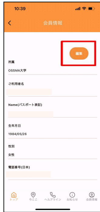
②右上にある「編集」をタップ