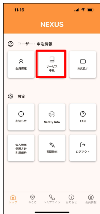
①「サービス申込」をタップ