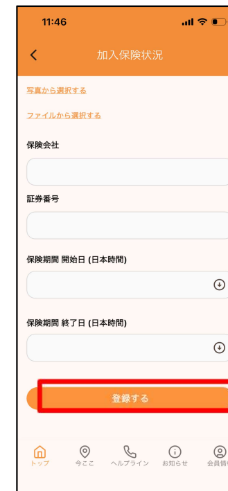
⑤画像アップまたは 詳細入力後 「登録する」をタップ

ヘルプライン利用時のスムーズなアシスタンスのために、加入された海外旅行保険の証券画像アップまたは「保険会社名」「証券番号」「保険期間」の登録をお願いします。