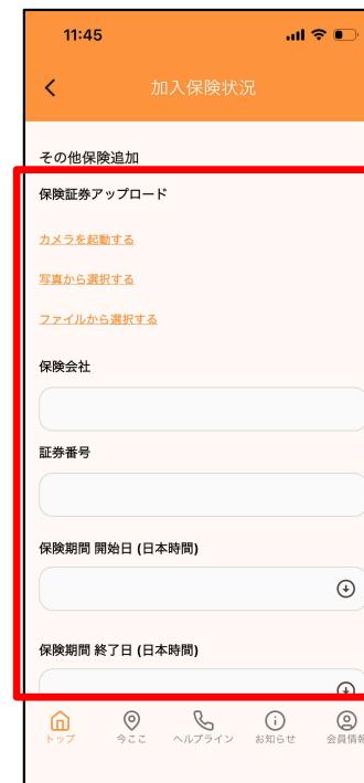
④証券画像をアップロード または、保険会社・ 証券番号等入力