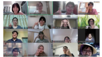
Welcome New ABP Students: Zoom Meet and Greet

「静大パディ」は、留学生・日本人学生でペア/グループを作り、文化、経験、言葉、時間を共有し、支えあうことを目的としたコミュニティです。月に2回イベントを開催し、パディに参加していない人も含めて、学部・学年・国籍に関係なく繋がる機会をもっています。学生たちがボランティアサポーターとして活動しています。