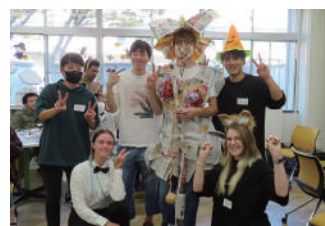
新聞紙でハロウィンコスチューム作成

学期中に毎週木曜日の午後で開催されている交流イベントです。趣味、恋愛、食文化など様々なトピックについて話したり、ピクニックやゲームを楽しんだりしています。国際交流活動に関心のある学生たちが積極的にイベントの企画運営に関わっています。