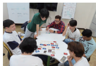
カードゲームで英語学習

2023年4月から始まった新しい企画です。英語が堪能な留学生と一緒に、ゲームやカジュアルな英会話を楽しみながら、英語力を向上させることを目的としています。留学生が進行役を務め、リラックスした雰囲気の中で英語力を鍛えられます。毎週1回、2時間実施されており、参加者から好評を博しています。