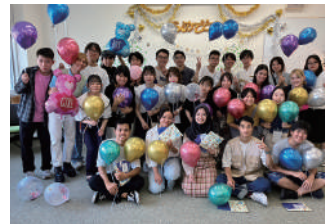
ABP生送別会 ABP students farewell party

「静大バディ」は、ABP生を中心とした留学生と日本人学生間の国際交流の機会としての学生コミュニティです。留学生・日本人学生でペア/グループを作り、お互いにサポートしながら交流することを目的としています。また月に2回イベントを開催し、バディに参加していない人も含めて、学部・学年・国籍に関係なく繋がる機会をもっています。