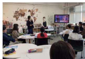
劇団SPACゲスト企画 Event with theatre company SPAC

国際経験のある静大の先生から学生時代の留学経験や、海外での研究生活に関する話を聞きながら交流する、学生や教職員を対象にしたキャンパス全体のネットワークイベントです。そのほか特別企画として、地域のアーティストや団体とのコラボイベントも開催しています。