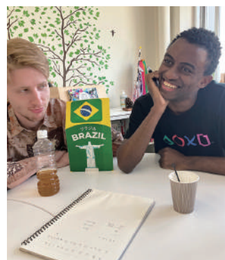
世界の言葉カフェ Café Lingua

学内の国際交流の拠点としてラウンジを活気づけていくために、学生たちがボランティアサポーターとして活動しています。それぞれの得意なことを生かしたイベントの企画や、ラウンジの様子を伝えたり帰国した留学生と繋がる場としてのpodcastラジオ配信、世界各国からきた留学生が自分の国の文化・言葉・音楽をシェアする場としての「Café Lingua: 世界の言葉カフェ」、留学生の生活のサポートをする「サポートラウンジ」など、ユニークで楽しい活動を展開しています。