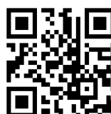
就職カウンセラー予約