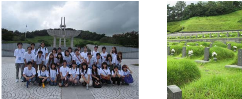
5.18 国立墓地 前日にもらったTシャツを着ていきました

韓国文化体験は、通訳がつきます。また、どこへ行くのでも韓国学生ボランティアがついてきてくれて、写真をとってくれたり、見守ってくれたりしています。テコンドーはきついけれど、貴重な体験になります。キムチ作り、韓国音楽は印象に残るものになります。また、韓国民族衣装を着て写真を撮るのもよい思い出になるでしょう！