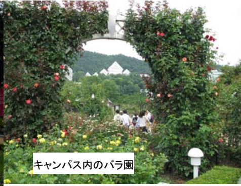
キャンパス内のバラ園