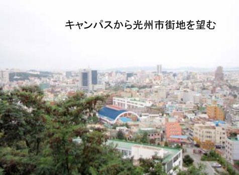
キャンパスから光州市街地を望む