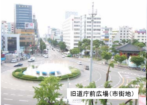
旧道庁前広場(市街地)