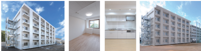
Gambar dari "Hunian International" dibangun pada bulan Maret 2016 di Shizuoka dan Hamamatsu. Tersedia 5 unit kamar lengkap dengan peralatan dan satu ruang umum.

Universitas menawarkan asrama dengan biaya terjangkau bagi seluruh mahasiswa internasional. Biaya sewa kamar setiap bulan kurang lebih 20.000 Yen Jepang. WiFi/akses internet berkecepatan tinggi tersedia dalam tiap unit.